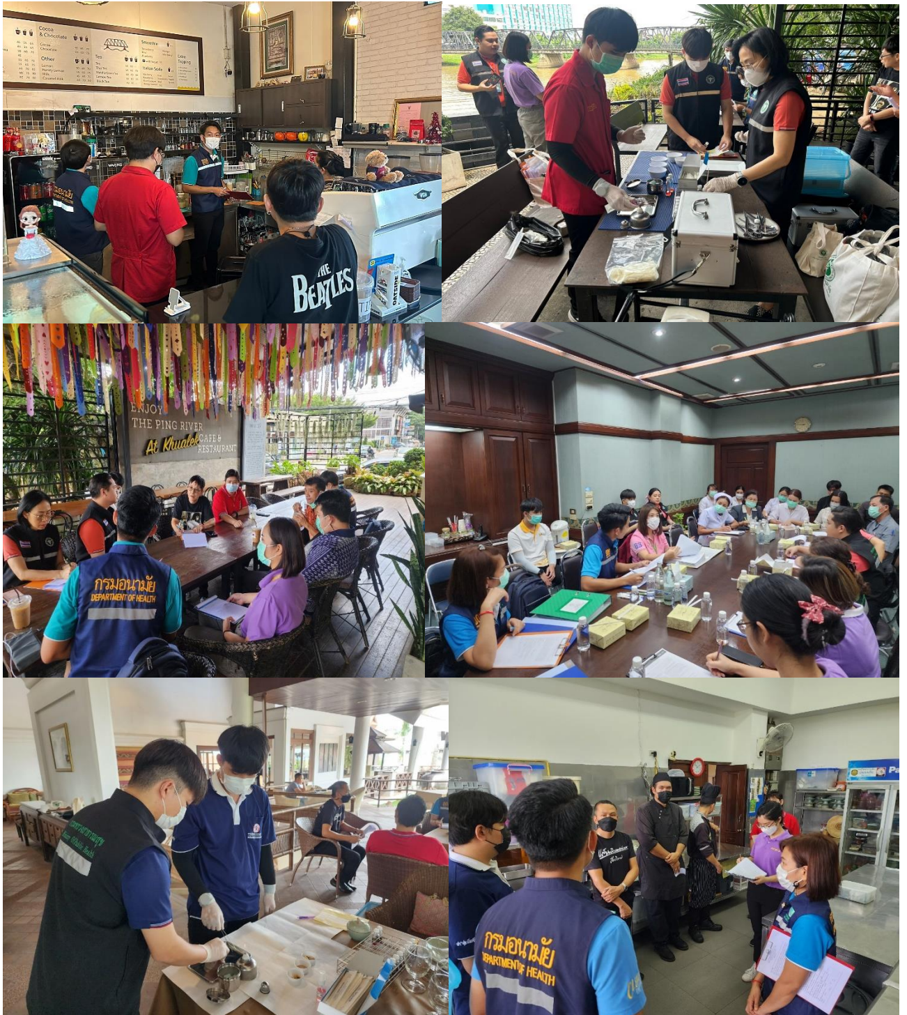
ภาพการดำเนินงานในโครงการ

ลิงค์สนับสนุนโครงการ: https://foodhandler.anamai.moph.go.th/event_show?action=view&id=14679